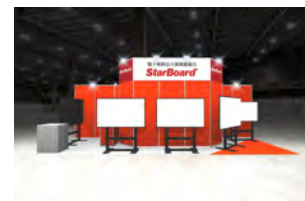
ブースイメージ図